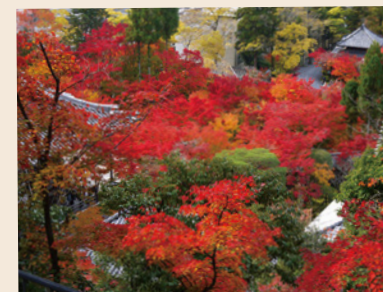
永観堂 1000年以上の昔から、「秋は紅葉の永観堂」と親しまれている紅葉の名所。池泉回遊式庭園を彩る紅葉は永観堂の見どころの一つ。

古都京都には、紅葉狩りを存分に堪能できる紅葉の名所が数多くあります。このような美しい景勝に恵まれた京都の風情、それを表現できないかという思いで、細タペストリー「紅葉狩り」を製作いたしました。秋の美しい景色を細タペストリーで、どうぞお楽しみください。