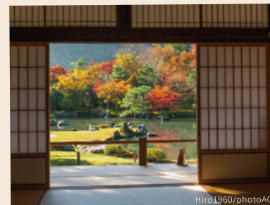
そうげんち 世界文化遺産・天龍寺の「曹源池庭園」 日本初の国の史跡・特別名勝に指定された名庭園。一年を通して季節の花木が見られ、紅葉も格別の美しさを見せてくれます。

平安の貴族たちが船遊びをした大堰川では、今も屋形船が行き交い、秋には紅葉狩りを楽しむ人々で賑わいます。