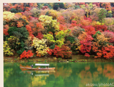
おいがわ 京都嵐山一大堰川の屋形船

平安の貴族たちが船遊びをした大堰川では、今も屋形船が行き交い、秋には紅葉狩りを楽しむ人々で賑わいます。